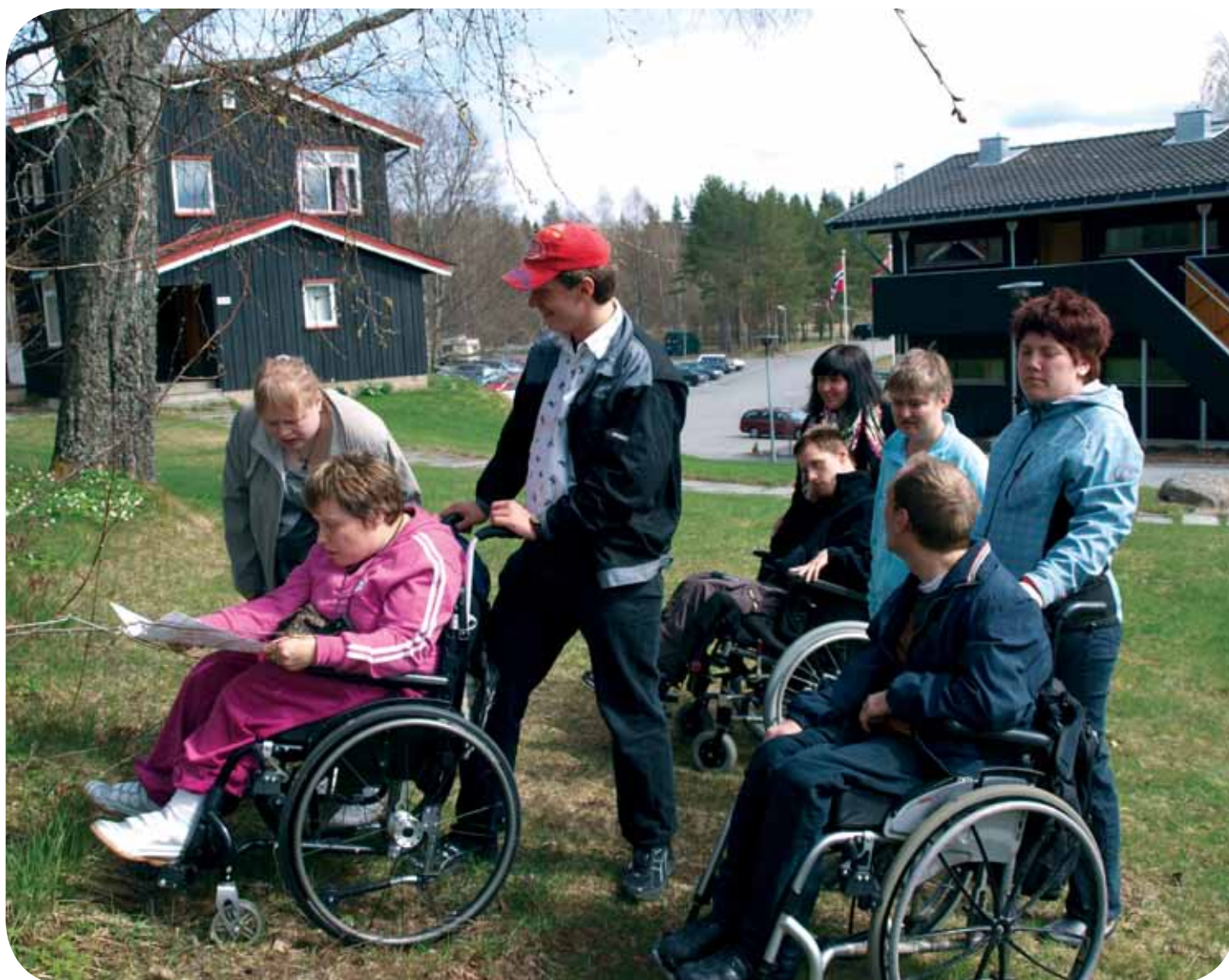
Her er noen av deltagerne på tidligere kulturverksted på Sørmarka