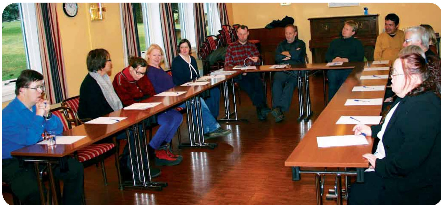
Deltakerne på kurset «Helse og sunn livsstil» arrangert av NFU Oslo fylkeslag er samlet for første gang.

I slutten av november arrangerte NFU Oslo fylkeslag et kurs for utviklingshemmede om helse og sunn livsstil. Kurset ble fulltegnet, og alle deltagerne hadde en fin helg på Sanner Hotell. Her er noen bilder fra kurset.