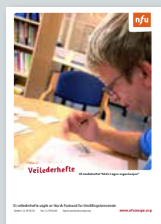
Veilederhefte til studieheftet «Aktiv i egen organisasjon»