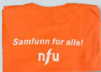
T-skjorte størrelse M og XXL kr. 70,-