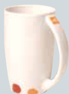
Krus (porselen) kr 200,-