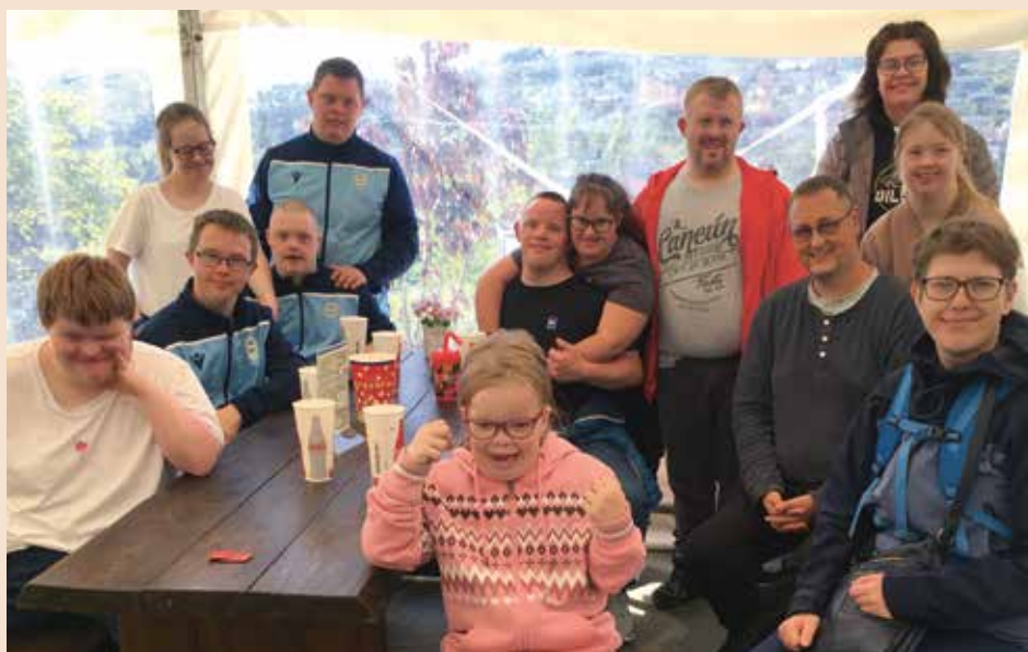
BJØNNSSTUGUA > ligger vakkert til ved Trysilelva.