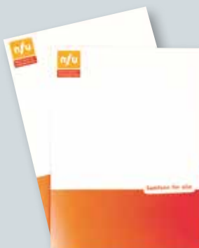
Kursmappe kr 25,-