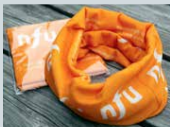
Multilue / bøff kr. 25,-