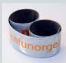
Refleksbånd kr. 25,-