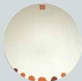
Tallerken (porselen) kr 150,-