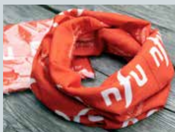
Multilue / bøff kr. 25,-