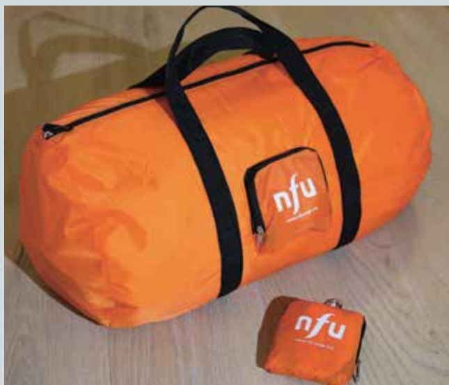
Pølsebag med utvendig lomme kr. 150,-