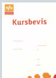
Kursbevis kr 10,-