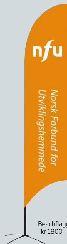
Beachflagg kr 1800,-