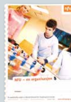
NFU – en organisasjon