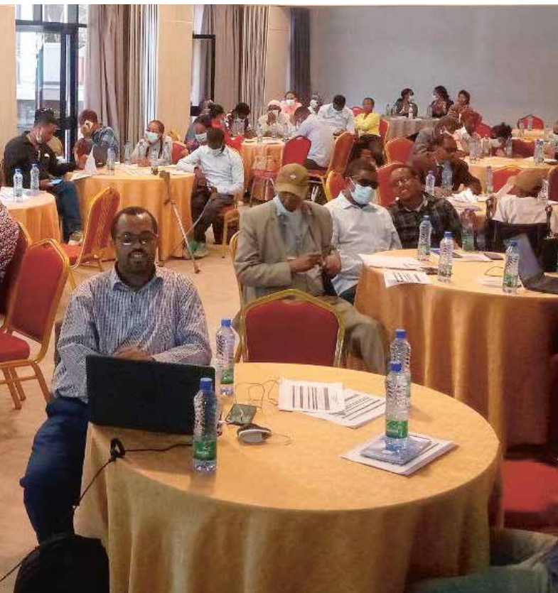
FEAPDS KURS i påvirkningsarbeid for sine medlemsorganisasjoner.

verket håper de å stille sterkere, samle ressurser og dra i samme retning. Med midler fra NFU jobber de også med å kurse medlemsorganisasjonene sine i påvirkningsarbeid. Fra Norge forsøker vi å bidra ved å informere den norske ambassaden og oppfordre dem til å ta opp loven i sin dialog med etiopiske myndigheter.