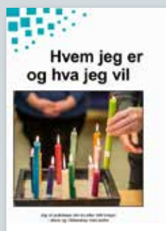
Om tro og livssyn