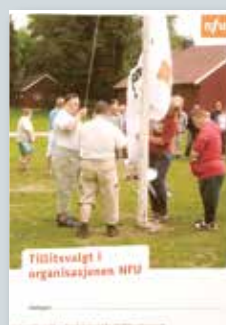
Tillitsvalgt i organisasjonen NFU