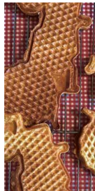
TRAKTORVAFLER ^ - nam nam!