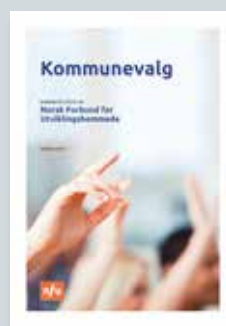
Kurshefte Kommunevalg (bokmål). Kr 50,-