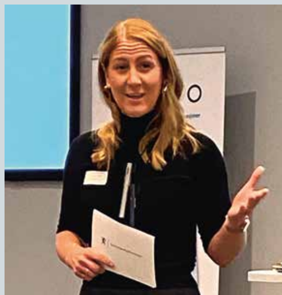
KUNNSKAPSMINISTER TONJE BRENNÅ (Ap) åpnet SAFOs konferanse om inkluderende utdanning.

https://www.facebook.com/226274574197441/videos/450290923786056