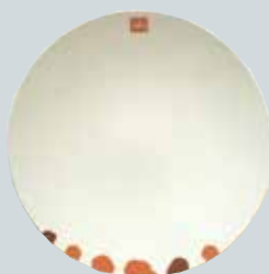
Tallerken i porselen kr 150,-