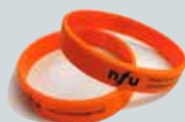
Armbånd kr. 10,-