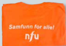
T-skjorte størrelse M og XXL kr. 60,-