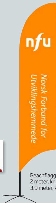
Beachflagg: 2 meter, kr 1100,- 3,9 meter, kr 1800,-