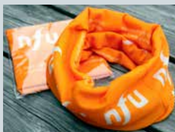
Multilue / bøff kr. 30,-