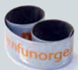
Refleksbånd kr. 25,-