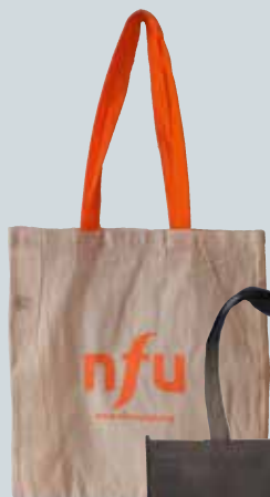
Nytt og forbedret handlenett kr 60,-