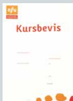
Kursbevis kr 10,-