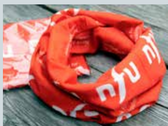
Multilue / bøff kr. 30,-