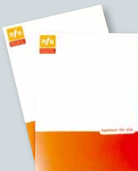
Kursmappe kr 25,-