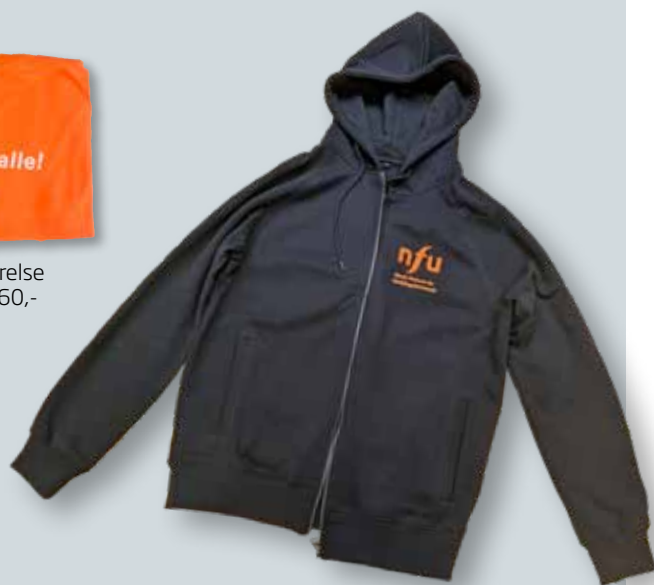
Hettejakke kr 400,-