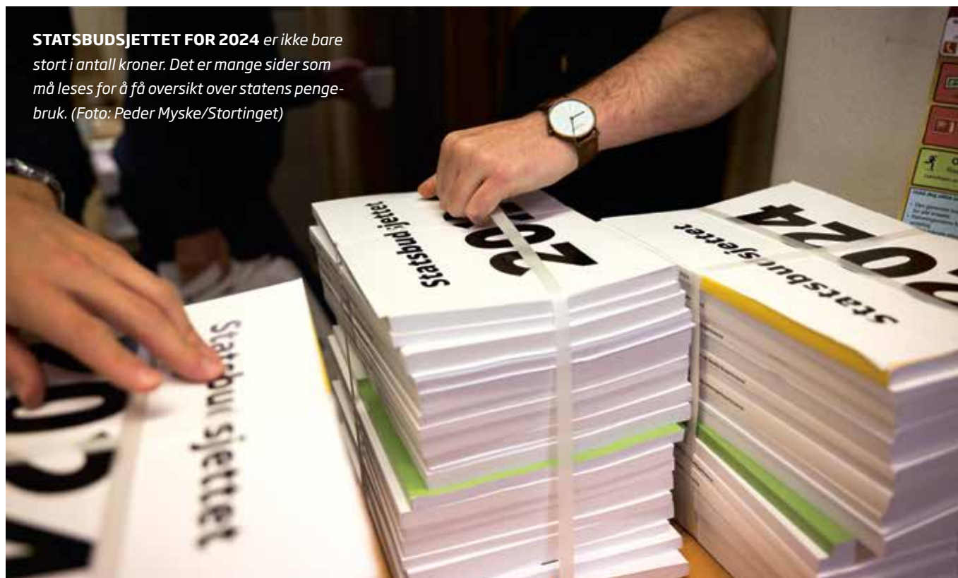
STATSBUDSJETTET FOR 2024 er ikke bare stort i antall kroner. Det er mange sider som må leses for å få oversikt over statens pengebruk.

Uavhengig av hvilke kommunikasjonsformer eller -midler de benytter, har de behov for opplæring i hvordan bruke dem. Bare slik kan de benytte de i samtaler med andre, eller i opplærings situasjoner.