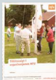
Tillitsvalgt i organisasjonen NFU