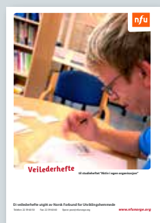
Veilederhefte til «Aktiv i egen organisasjon»