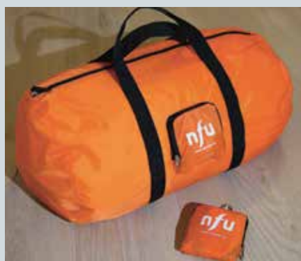
Pølsebag med utvendig lomme kr. 150,-