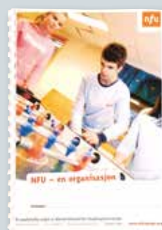
NFU - en organisasjon