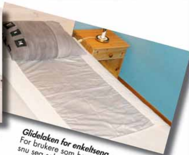
Glidelaken for enkeltenseng. For brukere som har problemer med å snu seg selv gjør glidelakenet det enklere.

Et hjelpemiddel som gjør det lettere for bevegelseshemmede eller smertepasienter å kunne endre stilling i sengen - alene, eller ved hjelp fra pleiere