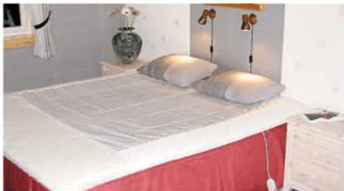
Glidelaken for dobbeltseng. Størrelsen på lakenet kan også lages etter ønske.