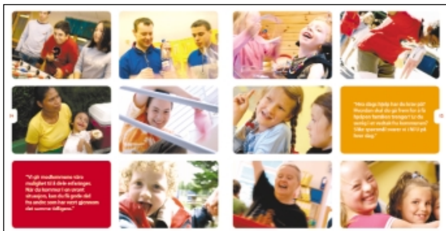
Midtsidene i informasjonsbrosjyren. Den er 30 sider og forteller hvorfor NFU er organisasjonen for personer med utviklingshemming

NFU bestilte i høst materiell med en bestillingsramme på 300 000 kr. Det ble satt av ytterligere 50 000 kr til å legge til rette informasjonsbrosjyren til lettlest og å utarbeide prinsippprogrammet i en lettlest utgave. Illustrasjonsfoto til bruk i organisasjonen er kjøpt inn med ramme på 50 000 kr. Utgiftene ble innarbeidet i budsjettrevisjonen for 2004. Det er satt av ytterligere midler i budsjettet for 2005 til informasjons- og profileingsmateriell.